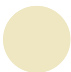
Beige RAL 1015